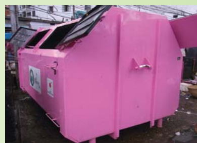
Container for Arm-roll Carrier