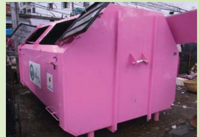
আর্ম রোল কন্টেইনার

এ্যানভাইরনমেন্টাল গ্রান্ট এইড প্রকল্প ঢাকা সিটি করপোরেশনের বর্জ্য ব্যবস্থাপনা বিভাগকে ১০০টি বর্জ্য সংগ্রহের গাড়ি প্রদান করেন। এর মধ্যে ২৯টি কম্পেক্টও এবং ১৬টি আর্ম রোল ট্রাক ঢাকা সিটি করপোরেশন ব্যবহার করছে। গত ১২ই জানুয়ারী, ২০১১ তন ধারণমতা সম্পন্ন সিএনজি চালিত কন্টেইনার ক্যারিয়ার এর কার্যক্রম শুরু হয়েছে। নতুন ড্রাইভার নিয়োগের পর আরো বেশী সিএনজি চালিত কন্টেইনার ক্যারিয়ার ঢাকা শহরে চালু হবে।